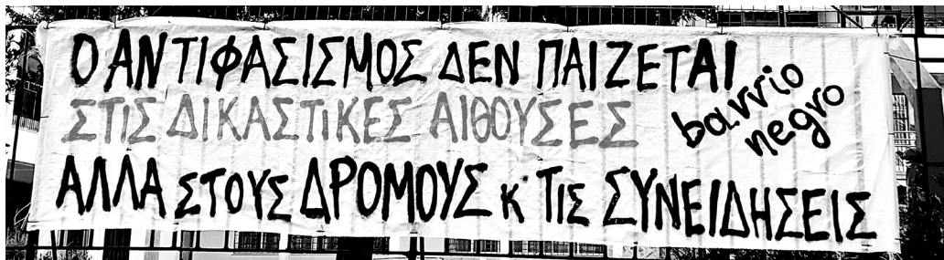
(πανό από τη μέρα της αντιφασιστικής πορείας για τη δολοφονία του Παύλου Φύσσα από νεοναζιστικό τάγμα εφόδου)

“Μαύρη γειτονιά” όμως γιατί και ως αγωνιζόμενα υποκείμενα στις περιοχές δεν μένουμε άπραγοι-ες στις φασιστικές προκλήσεις, στα κρατικά/καπιταλιστικά πλάνα περαιτέρω υποβάθμισης των ζωών μας. Έχουμε διαλέξει τον δρόμο της αυτοοργάνωσης της αλληλεγγύης και της αντίστασης. Επιδιώκουμε ένα αγωνιστικό-δημιουργικό-συντροφικό πεδίο διασταύρωσης, ζύμωσης και σύμπραξης εκείνων που από ακηδεμόνευτη και ρηξικέλευθη σκοπιά θέλουν να αντισταθούν σε κάθε μορφή εξουσίας, εκμετάλλευσης και καταπίεσης, όπως και στη λεηλασία της φύσης και της ζωής μας.